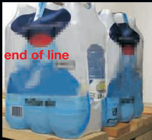
end of line

Complete lines for Beverage & Packaging industry